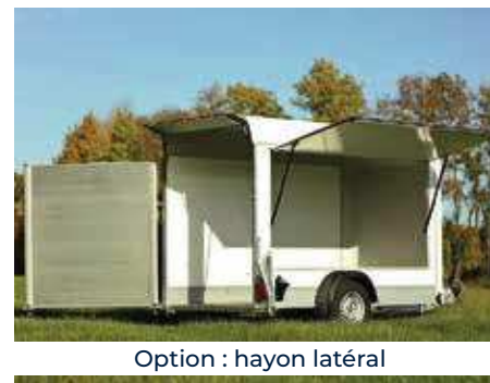
Option : hayon latéral