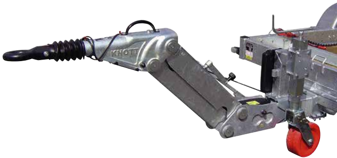
Timon articulé à parallélogramme

LES PLUS PRODUIT Facile et rapide à ajuster en hauteur Essentiel pour ceux qui possèdent plusieurs véhicules