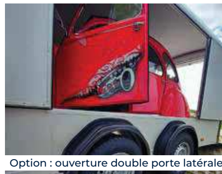
Option : ouverture double porte latérale